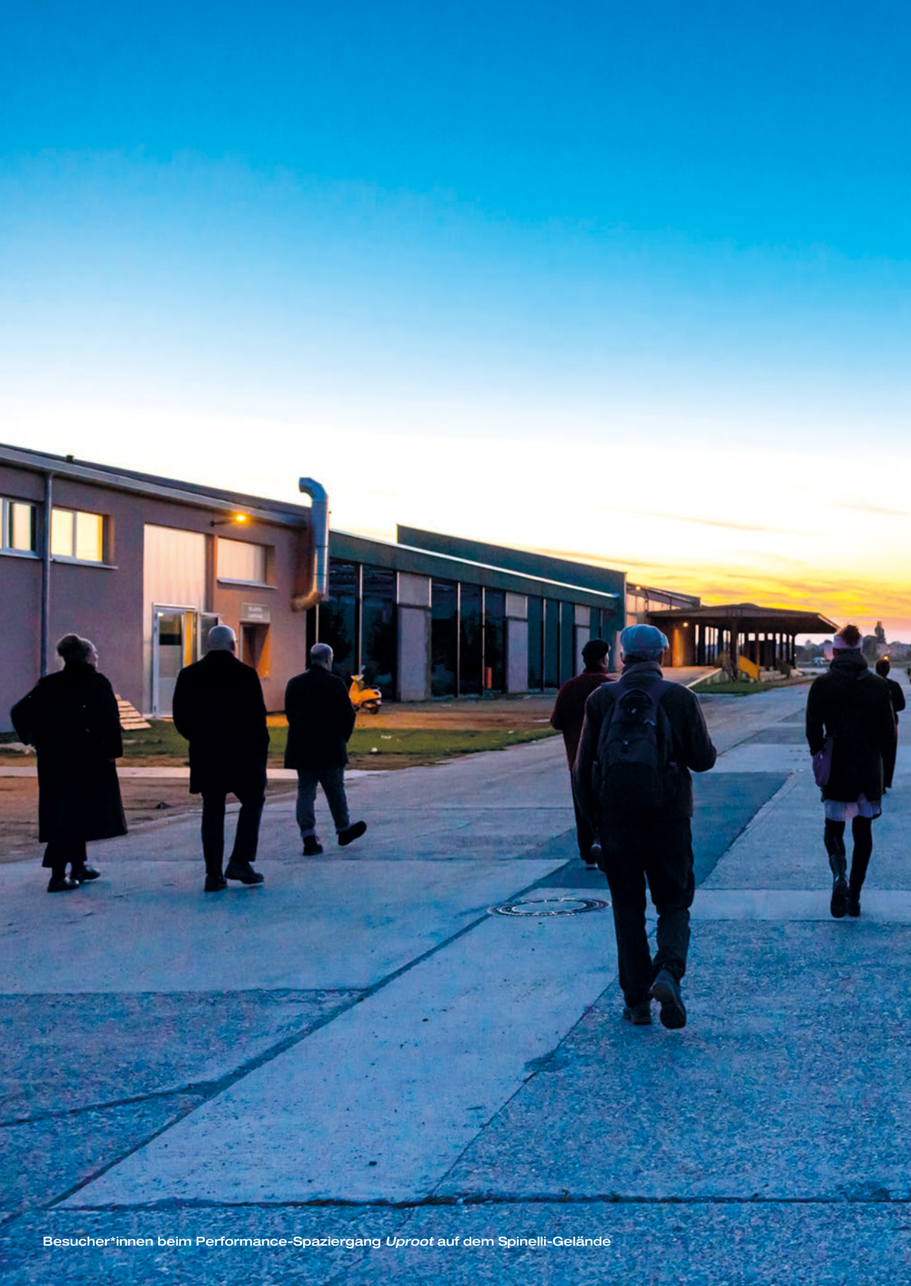
Besucher*innen beim Performance-Spaziergang Uproot auf dem Spinelli-Gelände