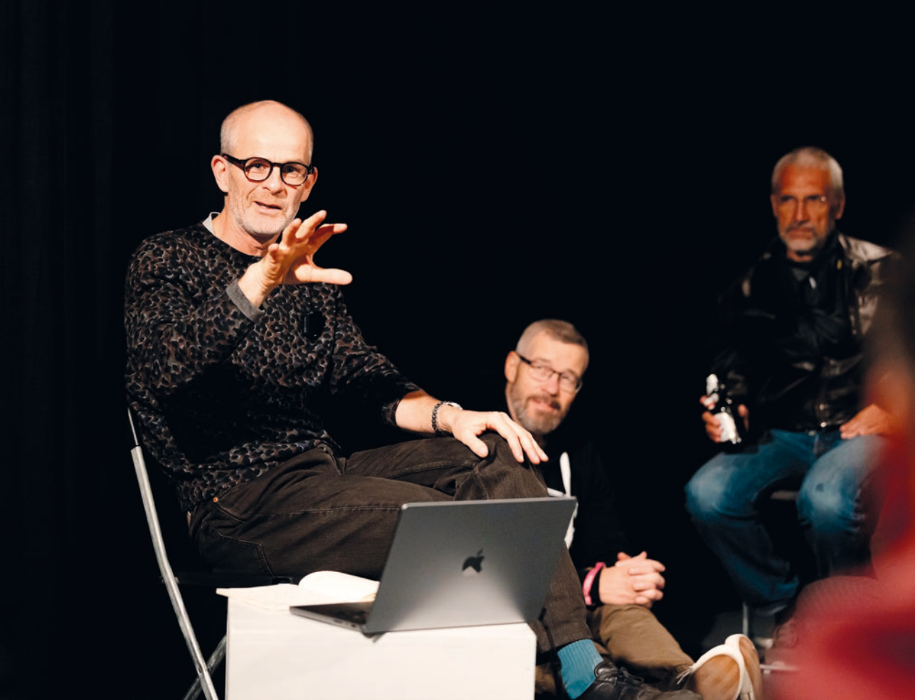
I The Moment of Silence , David Weber Krebs, Lecture-Performance, zeitraumexit r »What Have I Done to You?« , Baptist Coelho, Partizipative Performance, zeitraumexit